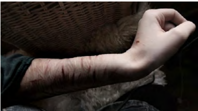
Auto-mutilações são comuns em pessoas com TPB.

Várias das características de instabilidade emocional estão presentes; além disso, a autoimagem do próprio paciente, objetivos e preferências internas (incluindo sexual) são, muitas vezes, pouco claras ou perturbadoras. Há geralmente sentimentos de vazio crônicos. A responsabilidade de se envolver em relações intensas e instáveis pode causar repetidas crises emocionais e pode estar associada a esforços excessivos para evitar o abandono e uma série de ameaças de suicídio ou atos de automutilação (embora estes possam ocorrer sem precipitantes óbvias).