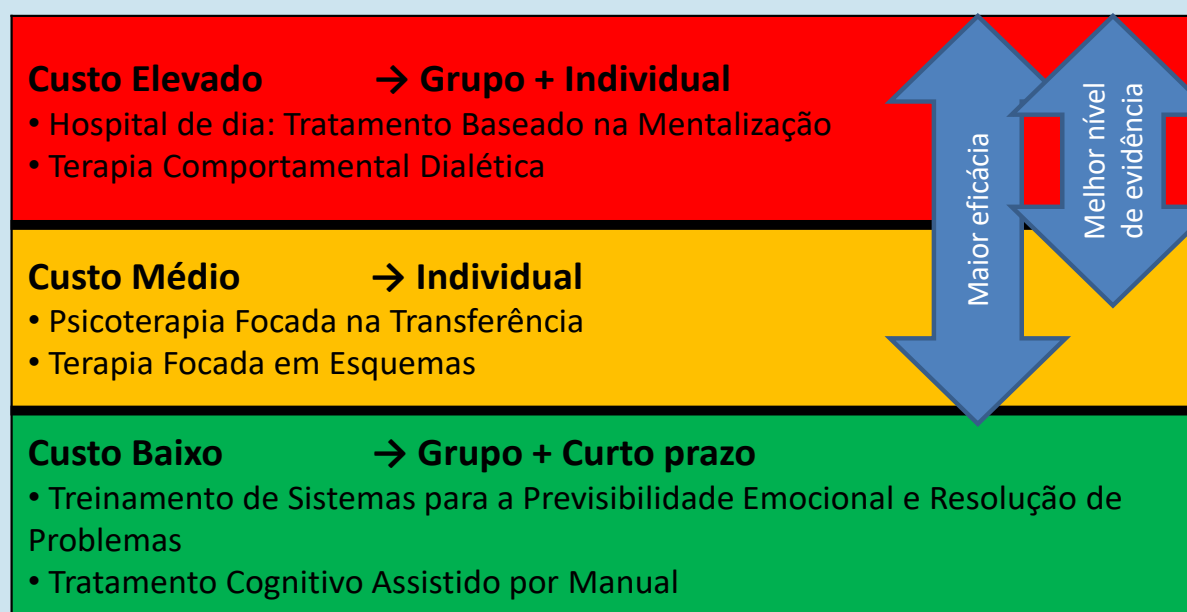
Figura H.4.1: Sumário comparativo de diferentes psicoterapias para o tratamento do transtorno de personalidade borderline.

Ao contrário de outras abordagens psicodinâmicas, o foco não é a transferência nem as relações do passado e o objetivo não é desenvolver um autoconhecimento biográfico, mas sim a recuperação da mentalização. Os terapeutas procuram promover um laço de apego seguro entre os membros de um grupo e entre o paciente e o próprio terapeuta. Este apego seguro constitui o contexto relacional propício à exploração da própria mente e da dos outros.