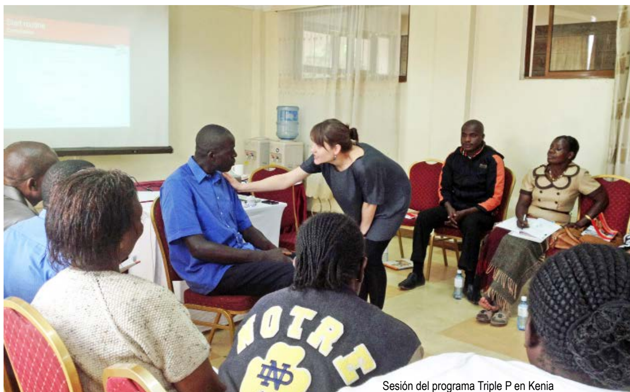
Sesión del programa Triple P en Kenia