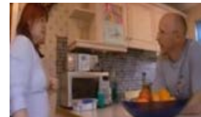
Pulse en la imagen para ver algunas familias que completan el Triple P grupal (4 videoclips por Brighton & Hove City Council). Se muestran algunas de las técnicas que Triple P enseña, y el efecto que tiene sobre el comportamiento de los niños.