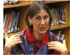
Pulse en la imagen para ver el programa de parentalidad Años Increíbles (Incredible Years) (20:01)