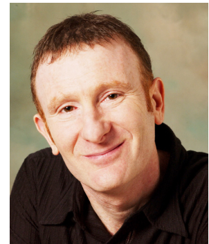
Cliquez sur la photo pour entendre le professeur Rapee parler des troubles anxieux (06:08)

réduire la réponse au traitement (Rapee et al, 2009). Une étude récente de notre unité clinique a un peu éclairé cette question. D'après nos données, il semble que la présence de comorbidités n'influence pas le degré de changement lors du traitement, mais influence l'état final. Comme les enfants avec comorbidités (en particulier troubles externalisés et dépression) ont souvent un niveau d'anxiété initial plus important, les résultats en fin de traitement sont souvent inférieurs à ceux des enfants sans comorbidité, bien que le degré de changement pendant le traitement soit comparable. Des études récentes ont commencé à montrer que les enfants avec autisme de haut niveau et comorbidité anxieuse répondent très bien au traitement de leur anxiété (Moree & Davis, 2010).