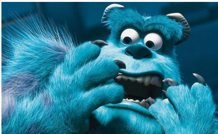
Monsters, Inc° Pixar

Edition en français Traduction : Jean-Philippe Raynaud Avec le soutien de la SFPEADA