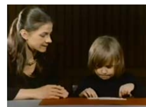
Часть 2 (13:05)