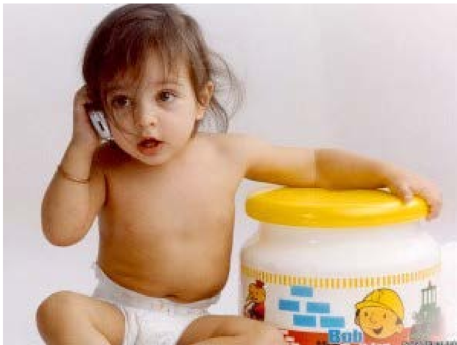
Имитация – быстрый способ приобретения навыков

В противоположность, как поддержанию равномерных темпов развития, так и созреванию через быструю серию «прорывов» дети демонстрируют значительную гетерогенность темпов развития. Такая вариабельность может, например, встречаться, как внутри разных сфер развития, так и между ними, при этом, например, могут отличаться темпы когнитивного развития в сравнении с социально-эмоциональным. Темпы развития у одного и того же ребенка могут быть разными в зависимости от периода созревания, например, в дошкольном возрасте и подростковом (Holmbeck и др., 2010). Несмотря на то, что ребенок может демонстрировать ускорение развитие речи в дошкольном возрасте, он или она может в то же время отставать от других детей в развитии моторной координации. В подростковом возрасте этот же ребенок может иметь соответствующие его сверстникам вербальные способности, при этом демонстрируя значительно более высокие достижения в моторной координации, по сравнению с другими подростками.