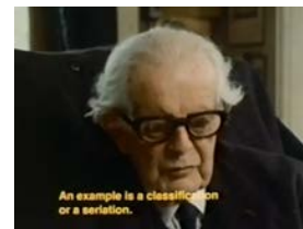
Часть 1 (12:25)

Нажмите на картинку что бы увидеть как теоретик развития Jean Piaget обсуждает и поясняет свою теорию интеллектуального развития (на Французском и Английском с английскими субтитрами).