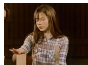
Часть 4 (4:49)