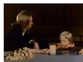
Часть 3 (11:30)