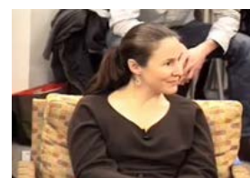
Нажмите на картинку для доступа к 2х - часовому видео круглого стола посвященного развитию темперамента

Продолжают совершенствоваться такие функции памяти, как хранение и воспроизведение – в этом возрасте дети могут подражать поведению других людей с увеличивающимся временным промежутком между наблюдаемым поведением и имитацией, а также имитировать это поведение в других условиях. Например, дома отец может, играя, ставить себе на голову игрушечную чашку, используя ее как шляпу. Позже, через неделю, в детском саду, или дома, или у родственников пятнадцатимесячный ребенок может делать то же самое, если обнаружит в комнате игрушечную чашку, демонстрируя отложенную имитацию поведения отца. На этой стадии дети также начинают сохранять в памяти