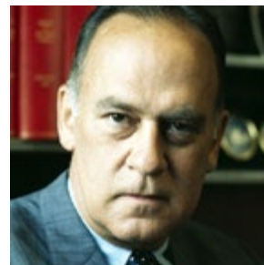
Potter Stewart (1915-1985) fue un Juez Asociado del Tribunal Supremo de los EE. UU.