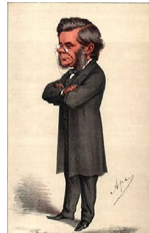
Thomas Henry Huxley (1825-1895) por Carlo Pellegrini (“Simio”) 1759-1840. Biblioteca Dibner, Institución Smithsonian.

“No veo rastro de propósito moral en la Naturaleza. Este es un artículo de fabricación exclusivamente humana, y de nuestro propio crédito” Thomas Huxley