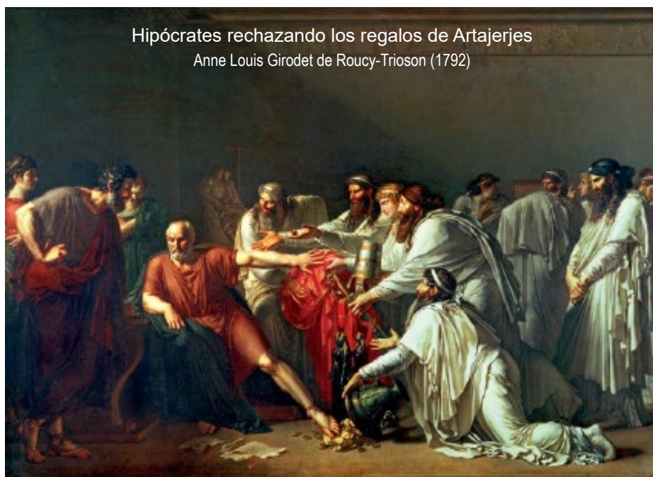
Hipócrates rechazando los regalos de Artajerjes Anne Louis Girodet de Roucy-Trioson (1792)