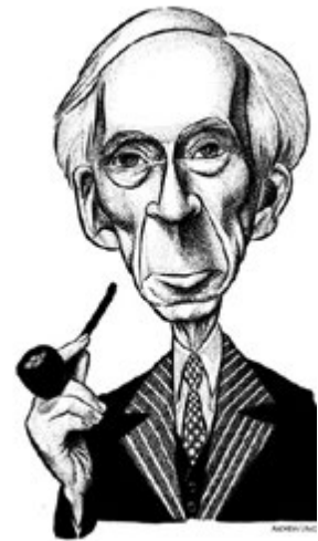
Bertrand Russell (1872-1970)

Parece adecuado que se usen los mismos métodos de razonamiento en todos los contextos. Las circunstancias, sin embargo, definitivamente deben considerarse en el intento de llegar a las soluciones más provechosas, y esas consideraciones bien podrían dar lugar a elecciones finales contrastantes en casos aparentemente similares.